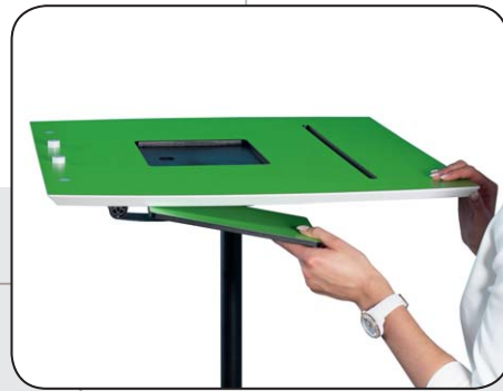
Praktische Ablage für die Abdeckplatte