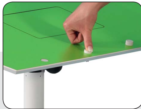
Großes Arbeitspult (74 cm x 61,5 cm) mit versenkbaren Vorlagenhalter ...