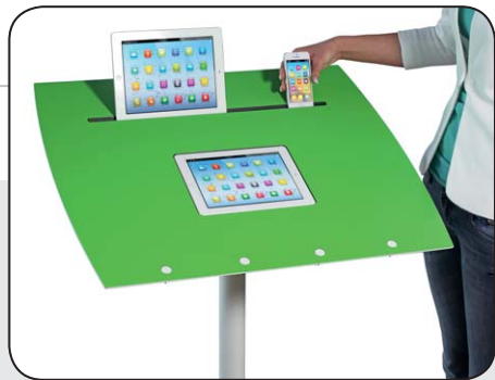
Breite Tablet-Rille für das Aufstellen Ihrer Smartphones und Tablets