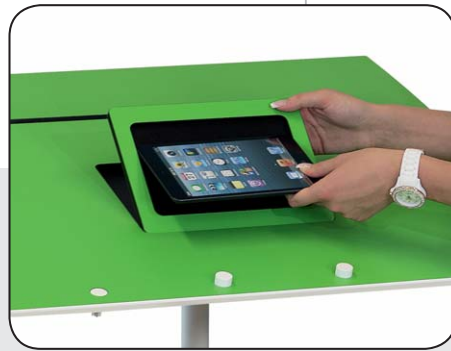
Rückseite der Abdeckplatte mit Aussparung für Mini iPad