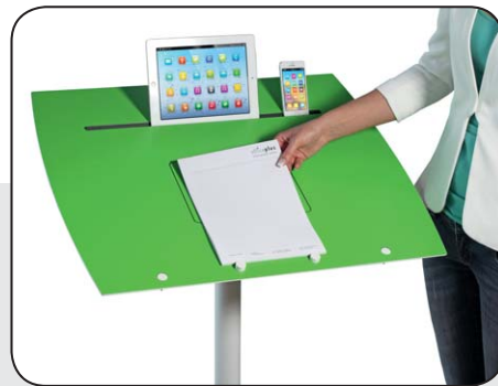
... zur Sicherung von Unterlagen