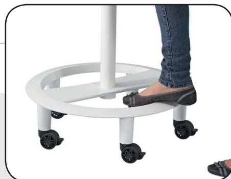
Mobilität durch fünf feststellbare Leichtlaufrollen Fußring für entlastendes Stehen

Tätigkeiten wie Eingeben, Redigieren, Präsentieren und Kommunizieren mit tablet rolls handlich und praktisch gelöst. Das mobile und vielseitig einsetzbare Multifunktions-Stehpult bringt Bewegung und Spaß in Ihr Büro oder home office und sorgt für ein entspanntes und Rücken entlastendes Arbeiten .