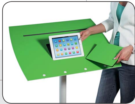
Passgenaue iPad-Aussparung für Ihr iPad (ab Version 2)

Einlegen - Aufstellen - Neigen - Bewegen - Loslegen !