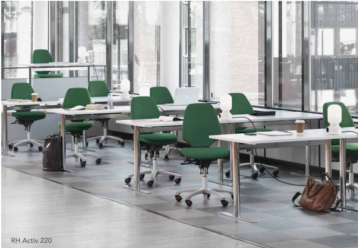
RH Activ 220