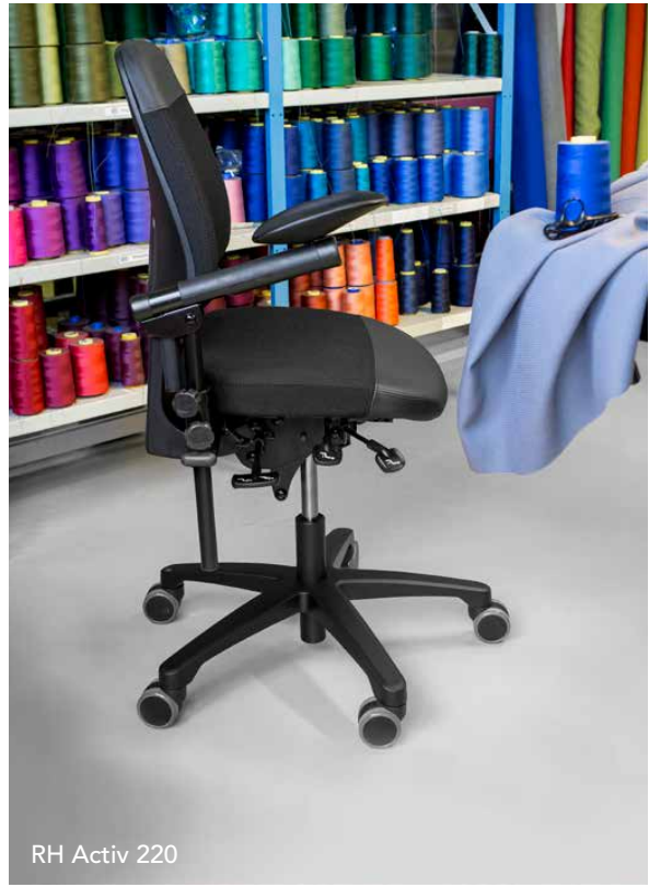
RH Activ 220