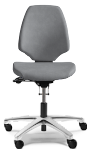
RH ACTIV 220

Der RH Activ 220 hat einen mittelgroßen Sitz, der nach vorn stark abfällt. Die schalenförmige, schmal zulaufende Rückenlehne mit ausgeprägter Lendenwirbelstütze gewährleistet guten Halt und Bewegungsfreiheit. Der Stuhl ist in der Standardausführung mit einem Fußkreuz aus schwarzem Aluminium und Rollen für weiche Böden ausgestattet. Den RH Activ 220 gibt es auch für Reinräume und als ESD-geprüfte Variante.