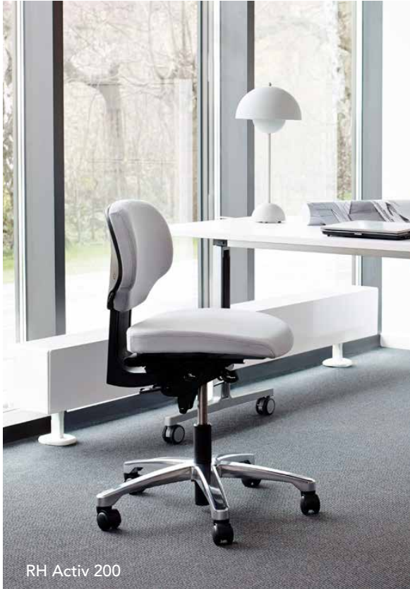
RH Activ 200