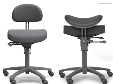
RH ACTIV 300

Der RH Activ 202 hat einen mittelgroßen Sitz, der nach vorn stark abfällt. Die mittlere, schalenförmige Rückenlehne ist mit einer ausgeprägten Lendenwirbelstütze ausgestattet. In der Standardausführung umfasst der Stuhl ein Fußkreuz aus schwarzem Polyamid und Rollen für weiche Böden. Den RH Activ 202 gibt es auch für Reinräume und als ESD-geprüfte Variante.