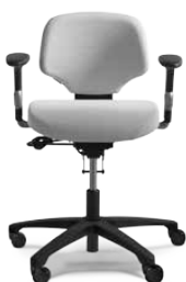
RH ACTIV 200

Der RH Activ 220 hat einen mittelgroßen Sitz, der nach vorn stark abfällt. Die schalenförmige, schmal zulaufende Rückenlehne mit ausgeprägter Lendenwirbelstütze gewährleistet guten Halt und Bewegungsfreiheit. Der Stuhl ist in der Standardausführung mit einem Fußkreuz aus schwarzem Aluminium und Rollen für weiche Böden ausgestattet. Den RH Activ 220 gibt es auch für Reinräume und als ESD-geprüfte Variante.