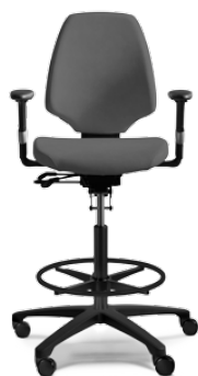
RH ACTIV 222

Der RH Activ 200 hat einen mittelgroßen Sitz, der nach vorn stark abfällt. Die mittlere, schalenförmige Rückenlehne ist mit einer ausgeprägten Lendenwirbelstütze ausgestattet. In der Standardausführung umfasst der Stuhl ein Fußkreuz aus schwarzem Polyamid und Rollen für weiche Böden. Den RH Activ 200 gibt es auch für Reinräume und als ESD-geprüfte Variante.