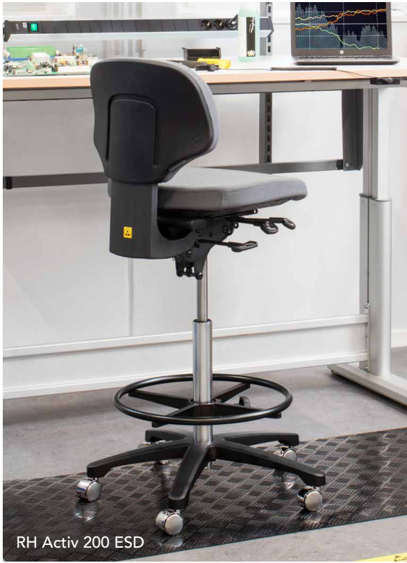
RH Activ 200 ESD