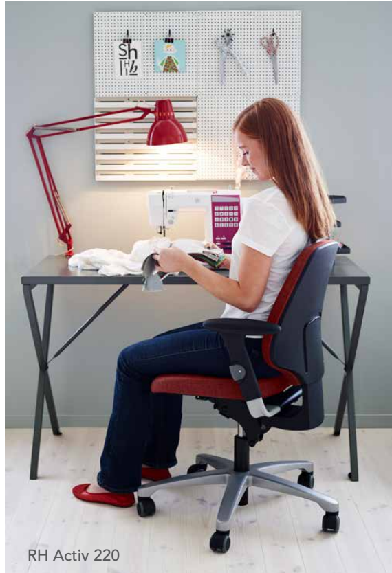
RH Activ 220