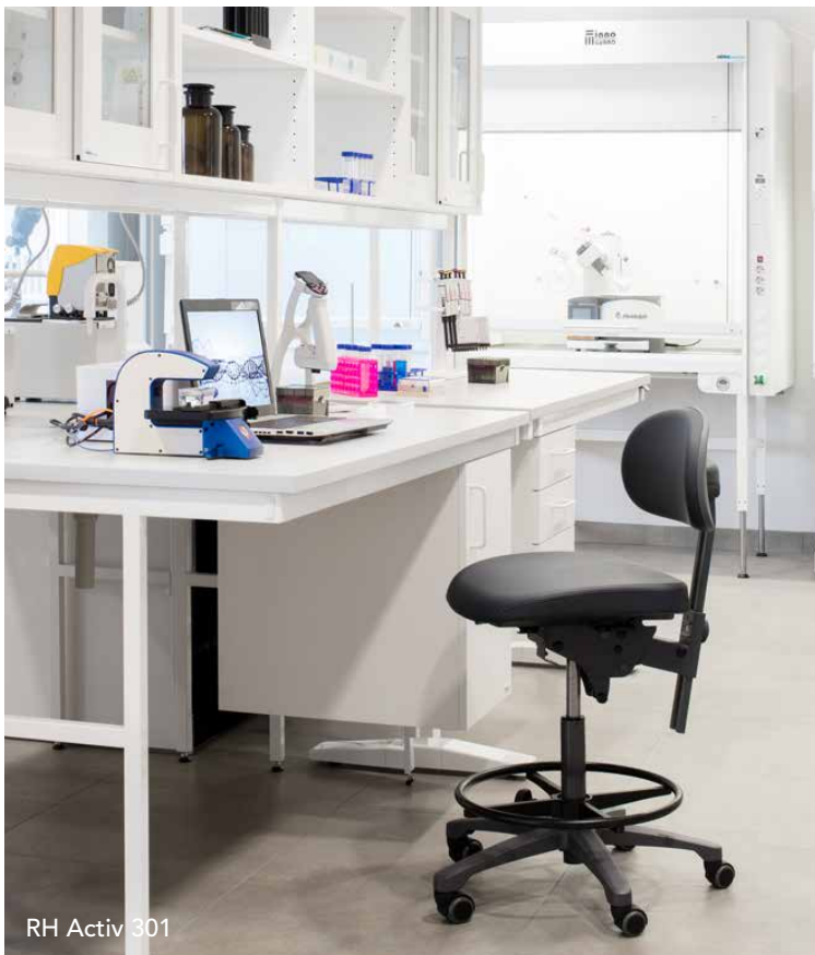
RH Activ 301