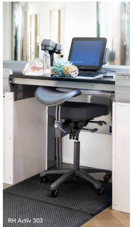
RH Activ 303