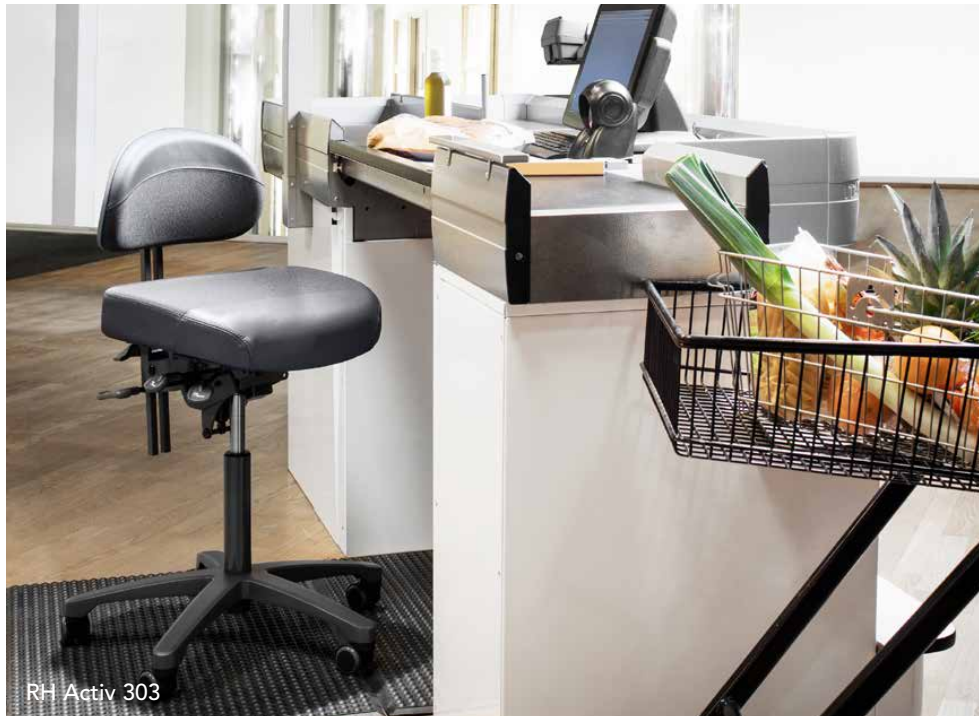
RH Activ 303