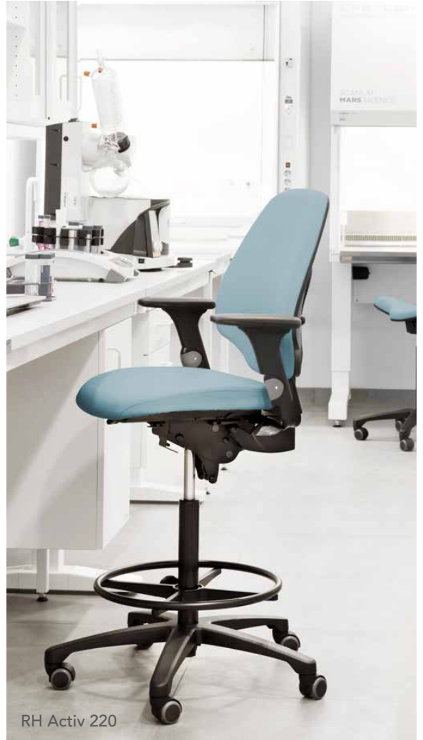
RH Activ 220