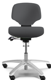
RH ACTIV 202

Der RH Activ 222 hat einen großen Sitz, der nach vorn stark abfällt. Die schalenförmige, schmal zulaufende Rückenlehne mit ausgeprägter Lendenwirbelstütze gewährleistet guten Halt und Bewegungsfreiheit. Der Stuhl ist in der Standardausführung mit einem Fußkreuz aus schwarzem Aluminium und Rollen für weiche Böden ausgestattet. Den RH Activ 222 gibt es auch für Reinräume und als ESD-geprüfte Variante.