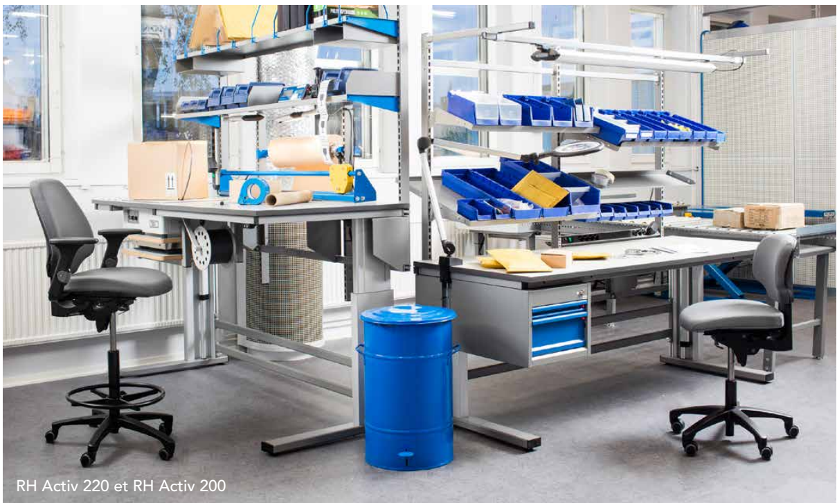
RH Activ 220 et RH Activ 200