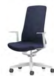
Drehstuhl, Rücken gepolstert

PURE IS3 passt perfekt in jedes Umfeld. Sein klares Design und die große Auswahl an Farben und Stoffen lassen viel Freiheit für eine individuelle Gestaltung. Die Kollektion umfasst vier Drehstuhlmodelle: Netz- und Polsterrücken, jeweils in weißem und schwarzem Design. Dabei kann aus einer Vielzahl an Materialien und Farben ausgewählt werden. Smart Spring, Stuhlsäule und die optionalen Armlehnen sind bei allen Modellen einheitlich entweder in Weiß oder Schwarz gehalten. Zur Auswahl stehen fixe T-Armlehnen oder 3D T-Armlehnen, die fixe T-Armlehne besticht durch ihr schlankes Design, die 3D T-Armlehne überzeugt zudem funktionell und ist in Höhe, Breite und Tiefe verstellbar.