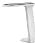
Fixe T-Armlehne, weiß