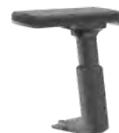
3D T-Armlehne, schwarz