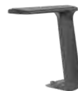
Fixe T-Armlehne, schwarz