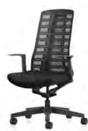
Drehstuhl, Rücken netzbespannt