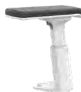
3D T-Armlehne, weiß