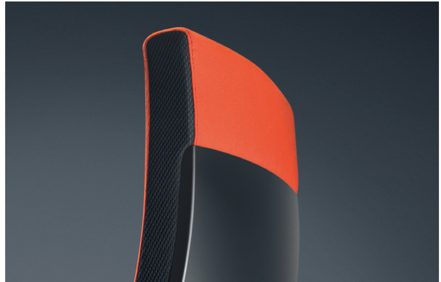
Schöne Form und interessantes Detail: der Kunststoffrücken