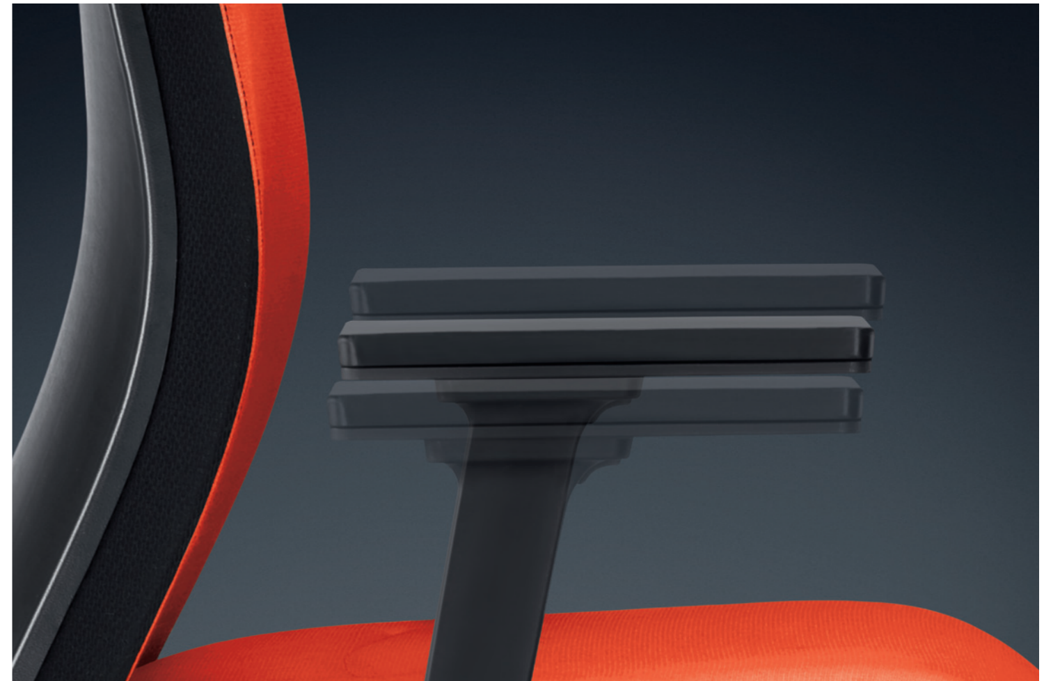
T-Armlehnen, 4D verstellbar in Höhe, Breite und Tiefe, schwenkbar.