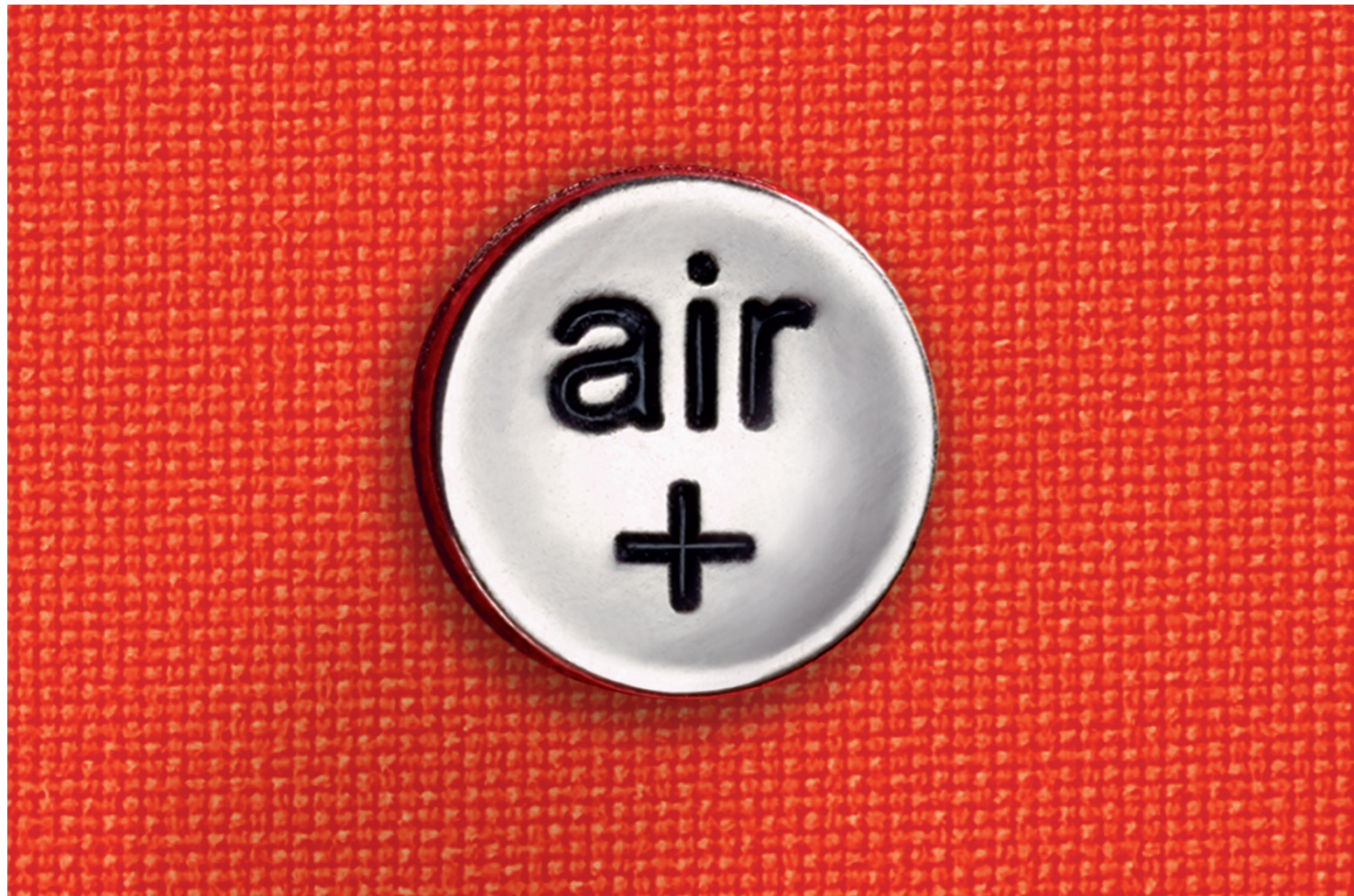
Die Lordosenstütze mit Air-Pressure-Technologie entlastet die Wirbelsäule auf Knopfdruck punktgenau.