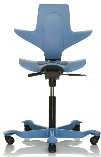
HÅG Capisco Puls 8010 Blau