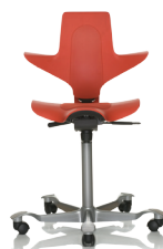
HÅG Capisco Puls 8010 Rot