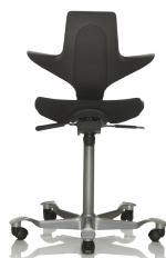
HÅG Capisco Puls 8020 Schwarz