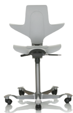
HÅG Capisco Puls 8010 Hellgrau