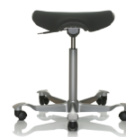
HÅG Capisco Puls 8002 Schwarz