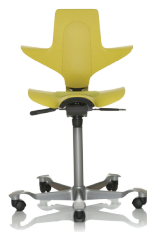
HÅG Capisco Puls 8010 Gelb