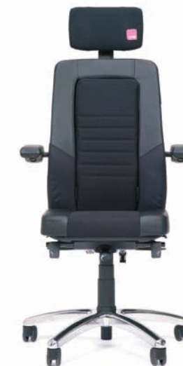
Axia ® Focus 24/7