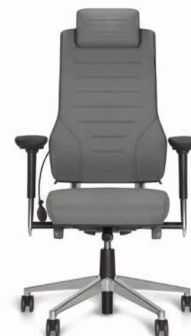
Axia ® Vision 24/7

ÜBERZEUGEN SIE SICH SELBST! FORDERN SIE IHR WUNSCHMODELL ONLINE ODER TELEFONISCH AN: