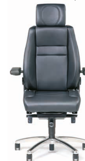
BMA Secur24 Exclusive

Rufen Sie uns einfach unter +49 211 310 610-0 an oder senden Sie uns Ihre Anfrage online: www.bma-ergonomics.com/de/teststuhl-anfordern