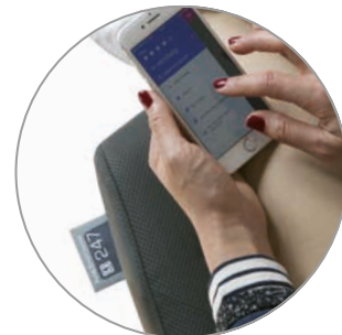
Axia Smart Active