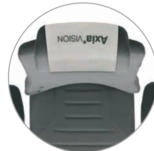
Schutzüberzug für die Kopfstütze