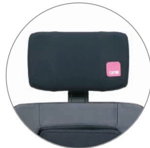
Schutzüberzug mit Logo