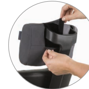
Schutzhülle mit Logo

lässt sich auf Wunsch mit folgendem Zubehör erweitern: