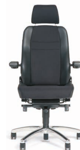
BMA Secur24 Basic