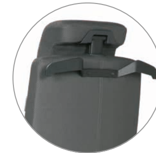
Kopfstütze und Kleiderbügel

lässt sich auf Wunsch mit folgendem Zubehör erweitern: