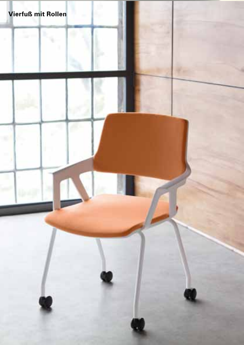
Vierfuß mit Rollen