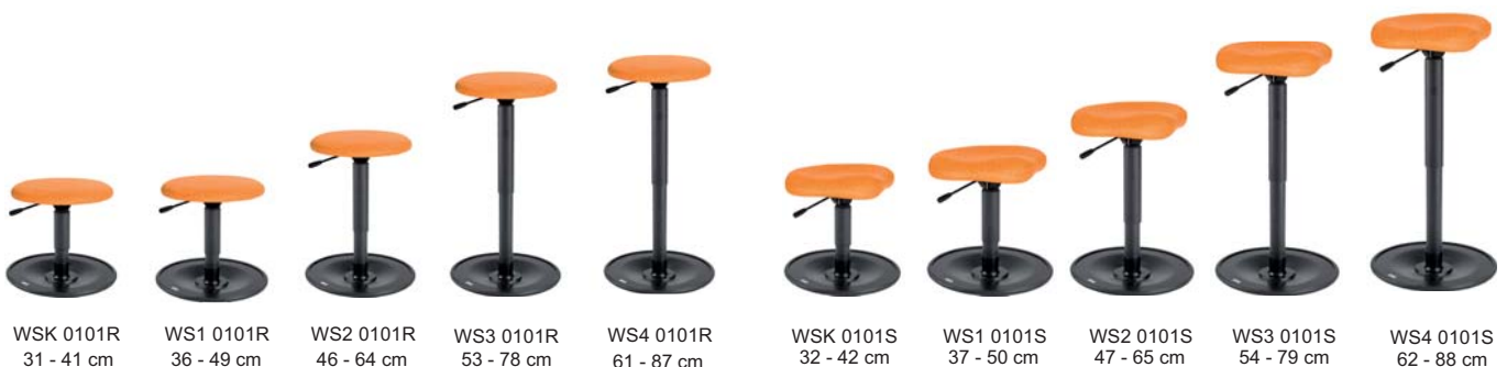
WSK 0101R 31 - 41 cm

Gestalten Sie Ihr Wunschmodell im Online Shop ergoshop.at