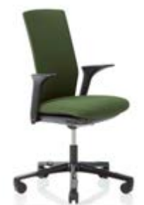
HÅG Futu 1200 solid FutuKnit solid Forest – FTU104