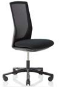
HÅG Futu 1102** Comm. mesh FutuKnit mesh Night – MEH099

Optionales Zubehör auf Wunsch: Armlehnen *Optionales Zubehör auf Wunsch: Lordosenstütze **Erhältlich mit fünfarmigem Fußkreuz