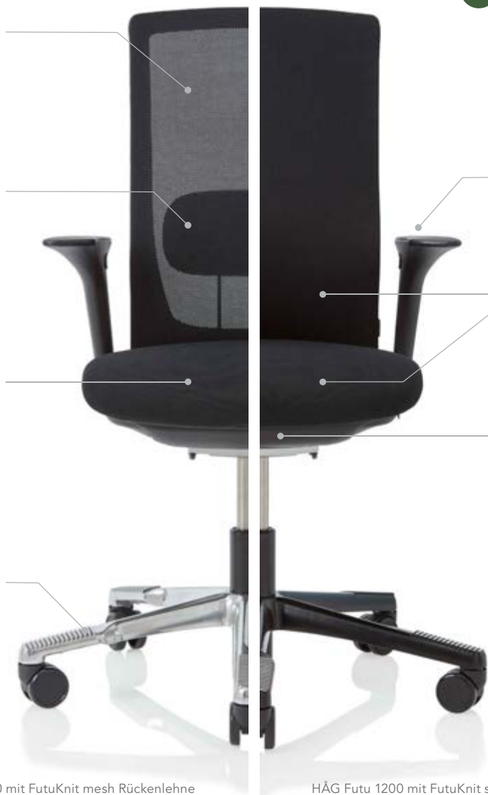
HÅG Futu 1100 mit FutuKnit mesh Rückenlehne

Fußkreuz Die einzigartigen Auflageflächen des Fußkreuzes bieten optimalen Halt und verhindern das Abrutschen der Füße. Dies unterstützt Sie bei der Nutzung der fußgesteuerten HÅG in Balance® Mechanik. Der Wechsel der Fußposition die Blutzirkulation stimuliert.