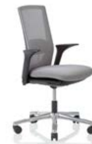
HÅG Futu 1100* mesh FutuKnit mesh Stone – MEH101