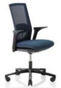
HÅG Futu 1100* mesh FutuKnit mesh Dusk – MEH102