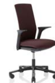
HÅG Futu 1200 solid FutuKnit solid Aubergine – FTU103