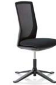
HÅG Futu 1102 Comm. mesh FutuKnit mesh Night – MEH099