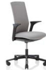
HÅG Futu 1200 solid FutuKnit solid Stone – FTU101