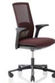
HÅG Futu 1100* mesh FutuKnit mesh Aubergine – MEH103