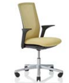
HÅG Futu 1100 mesh FutuKnit mesh Straw – MEH105