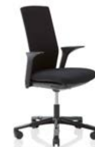
HÅG Futu 1200 solid FutuKnit solid Night – FTU099