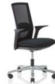
HÅG Futu 1100* mesh FutuKnit mesh Night – MEH099