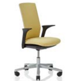
HÅG Futu 1200 solid FutuKnit solid Straw – FTU105