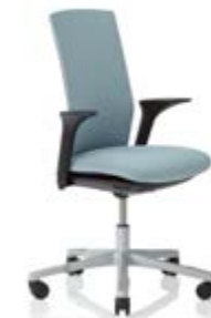
HÅG Futu 1200 solid FutuKnit solid Frost – FTU100