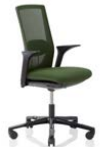
HÅG Futu 1100* mesh FutuKnit mesh Forest – MEH104