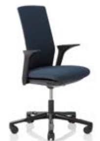
HÅG Futu 1200 solid FutuKnit solid Dusk – FTU102