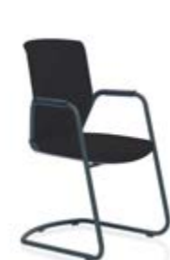
HÅG Futu 1070 Comm. FutuKnit solid Night – FTU099